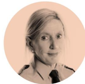
Carin Götblad, polismästare vid Nationella opera- tiva avdelningen.

"Jag har suttit i samtal med myndighetspersoner som sagt att barn- konventionen inte kan tillämpas för alla barn."